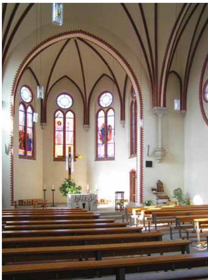
links: Blick in den Chorraum

Ein großes Schild – »Tritt ein – die Kirche ist offen« – lädt jeden Interessierten zum Besuch der Kirche ein. Unsere Stadt ist mit der katholischen Kirche schöner geworden. 2013 bekam die Gemeinde neue Kirchenfenster, die von den Glaskünstlern Georg Nawroth, Thomas Kuzio und Helge Warme gestaltet wurden. Fenster sind Augen des Bauwerks. Zwei große Rosetten auf beiden Seiten des Quergangs erstrahlen im Sonnenglanz. Für mich hat es den Anschein – Gott sieht ins Innere der Kirche. Acht kleine Fenster umkreisen ein großes Fenster in der Mitte. Das gesamte Weltall spiegelt sich in Gottes Augen und der runden Form der abstrakten bleiverglasten Fensterbilder wider. Gott wacht über die Gestirne und über jeden Menschen.