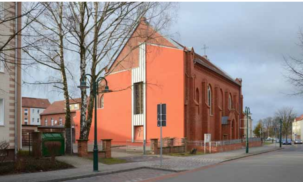
Die Katholische Kirche St. Otto mit Gemeindezentrum in Pasewalk