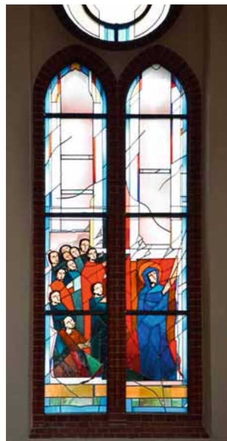
rechts: Eines der großen Fensterbilder im Chorraum