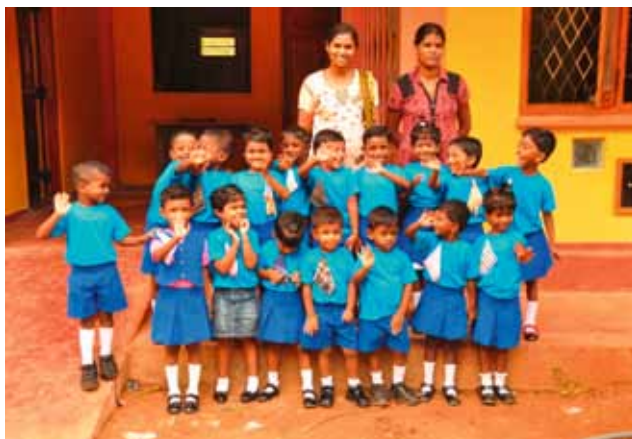
links: Vorschulklasse im Eluchiyaham- Center

Das Angebot des ehrenamtlich geleiteten Zentrums ist vielfältig: Kurse zu religiösen Themen, zu Friedensarbeit oder gewaltloser Erziehung/Kinderrechten; Vorschule; Sprachunterricht in Tamil, Englisch und Singhalesisch; Mathematik; Nachhilfe in allen gängigen Schulfächern, je nach Bedarf; Computerkurse; Instrumentalunterricht für Geige, traditionelle und moderne Percussion sowie für Orgel und Klavier; Kurse für modernen Tanz, für klassischen tamilischen Tanz sowie für klassisches tamilisches Theater, das man sich optisch so ähnlich wie die bei uns bekanntere Chinesische Oper vorstellen kann: reich an klassischen Rollen und Kostümen werden Ausdrucksformen von Musik, Gesang, Schauspiel und Tanz in lokaltypischen Ausformungen vereint. Komplettiert wird das Angebot von Eluchiyaham durch zwei qualifizierte Ausbildungsgänge, durch die Frauen die Möglichkeit erhalten, sich entweder zur Schneiderin ausbilden zu lassen oder im Kunsthandwerk mit Blättern der Palmyrapalme, aus der in Sri Lanka traditionell verschiedenste Alltagsgegenstände hergestellt werden. Beides hilft unmittelbar zur Versorgung der eigenen Familie und ermöglicht darüber hinaus ein eigenes regelmäßiges Einkommen.