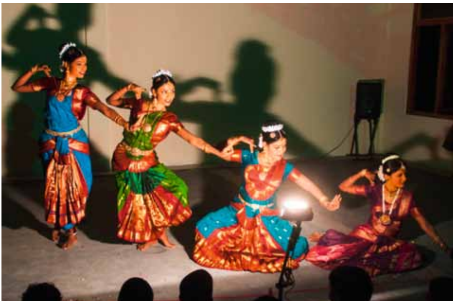
Nach langem Training und mit selbstgeschneiderter Kleidung: Klassischer tamilischer Tanz einer Eluchiyaham-Gruppe

Unter anderem in diesem Anliegen bitten wir darum, die Kollekte für weltkirchliche Aufgaben des Erzbistums Berlin am 29./30. August 2015 in allen Gemeinden tatkräftig zu unterstützen. HERZLICHEN DANK!