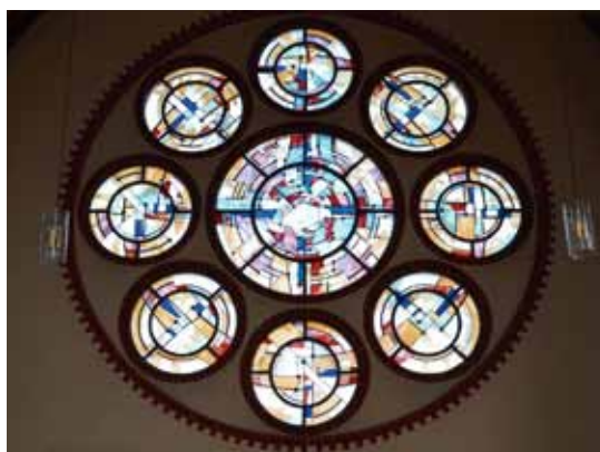
Eine der großen Rosetten über dem Quereingang

Nach dem 2. Weltkrieg wuchs die katholische Gemeinde spürbar an. Viele Gläubige kamen aus den ehemaligen deutschen Ostgebieten dazu. In den Jahren von 1960 bis 1985 wuchs Schwedt zu einem Industriestandort. Die Kirchengemeinde vergrößerte sich. Um die Jahrtausendwende gab es viele Austritte aus der Kirchengemeinde.